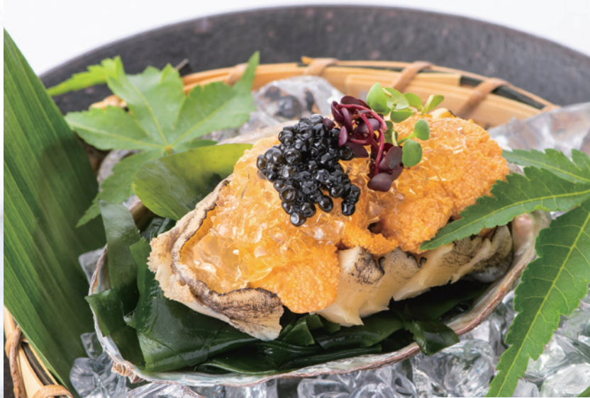
旬の鮑と雲丹の冷製 鱈出汁のジュレ Abalone and Sea Urchin with "Dashi" Jelly 4,450円