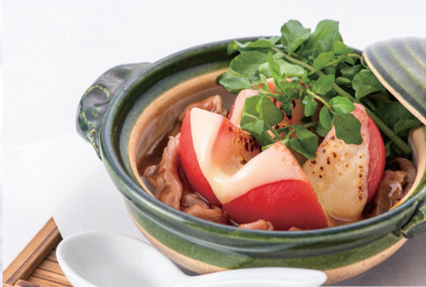
飛騨牛とトマトのすき焼き "Hida-gyu" Beef and Tomato Sukiyaki 3,800円