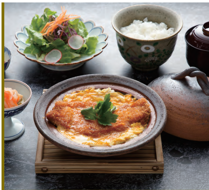
霧島産純粹豚ロースのカツ煮御膳

Boiled Kirishima pure Pork Loin cutlet Set Meal