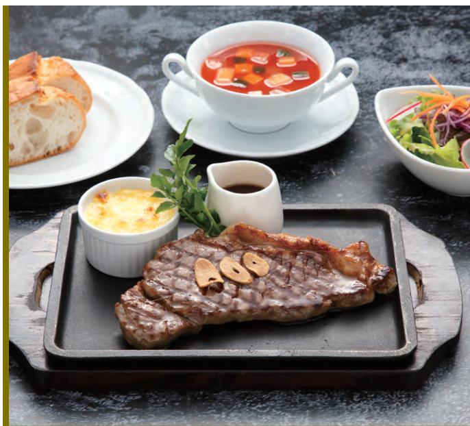
サーロインステーキ (スープ・サラダ・パン又はご飯付)

Sirloin Steak (with Soup, Salad, Bread or Rice)