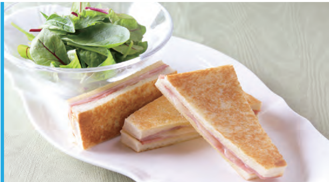
ホットサンドセット【ハム&チーズ】

Hot Sand Set <Ham&Cheese sand/Salad/Coffee or Tea>