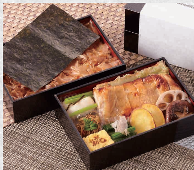
こだわりの海苔弁 『里の幸』