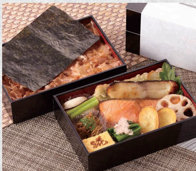
こだわりの海苔弁 『海の幸』