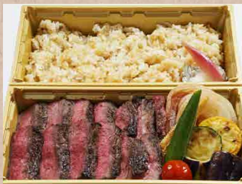
※写真は150g ステーキ重 (ガーリックライス)