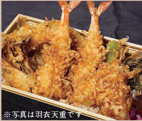
※写真は羽衣天重です