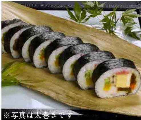
※写真は太巻きです