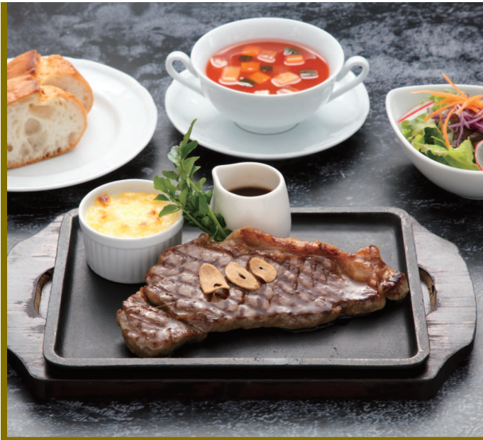
サーロインステーキ (スープ・サラダ・パン又はご飯付)

Sirloin Steak (with Soup, Salad, Bread or Rice)