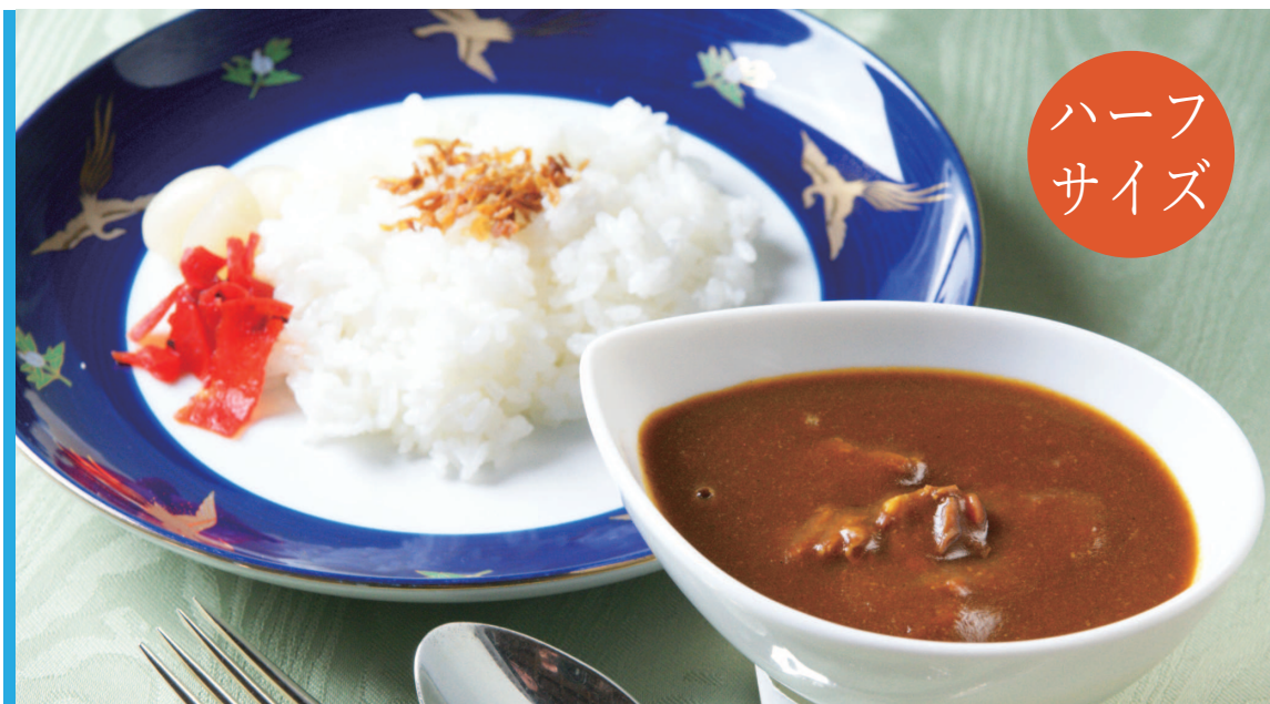
モーニングカレーライスセット

Meiji Kinenkan's Specialty Beef Curry Set <a half-serving of Curry /Rice 110g/Coffee or Tea>