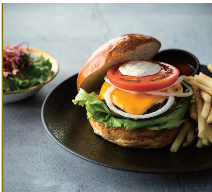
kinkeiバーガー (フレンチフライ・サラダ付)