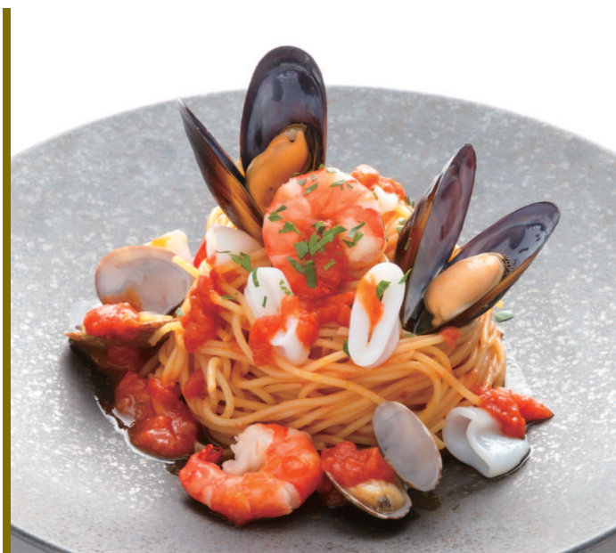
ペスカトーレロッソ (スープ・サラダ付)