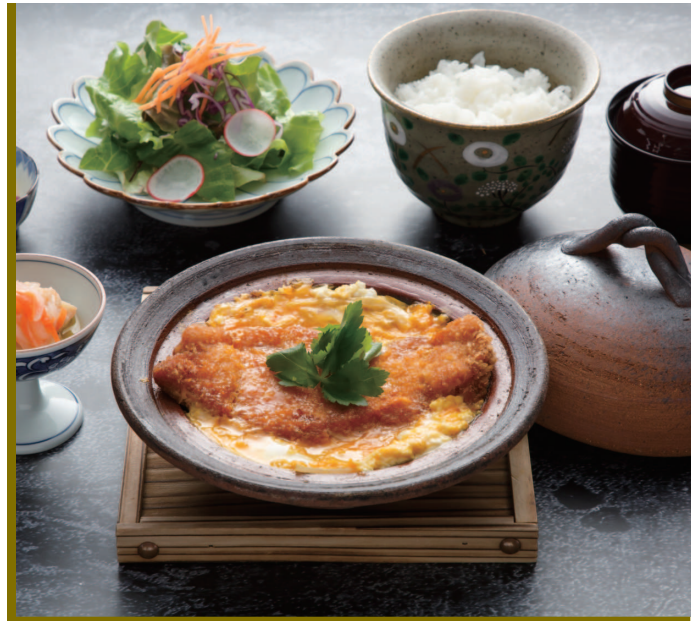
霧島産純粹豚ロースのカツ煮御膳

Boiled Kirishima pure Pork Loin cutlet Set Meal