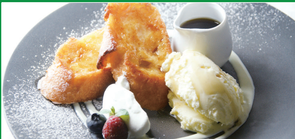
フレンチトースト -バニラアイス添え-