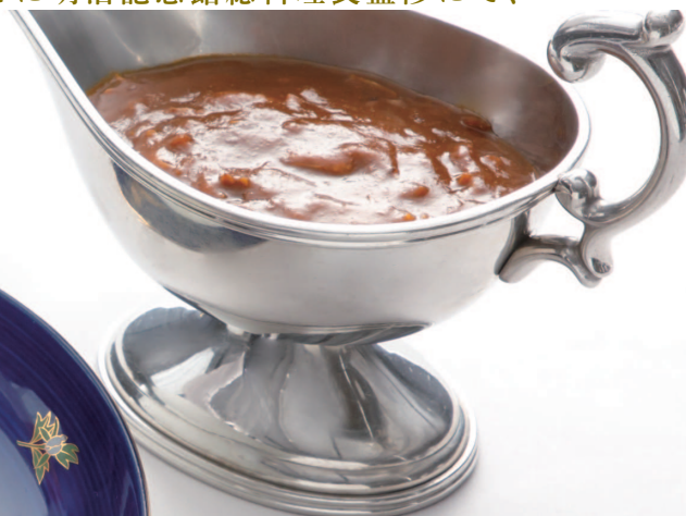
鴨肉のカレーライス