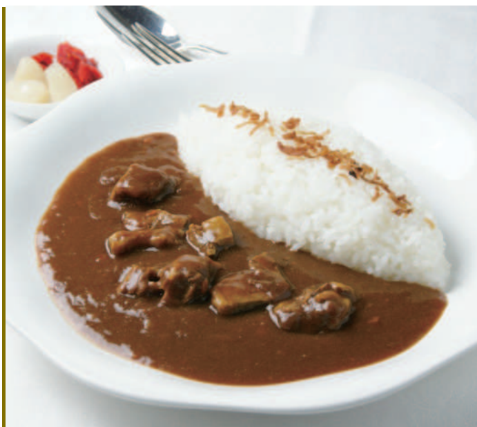
明治記念館のビーフカレーライス (スープ・サラダ付)

Meiji Kinenkan's Speciality Beef Curry and Rice (Soup with Salad)