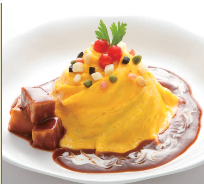
オムライス デミグラスソース (スープ・サラダ付)

Omelet rice with Demiglace sauce (Soup with Salad)