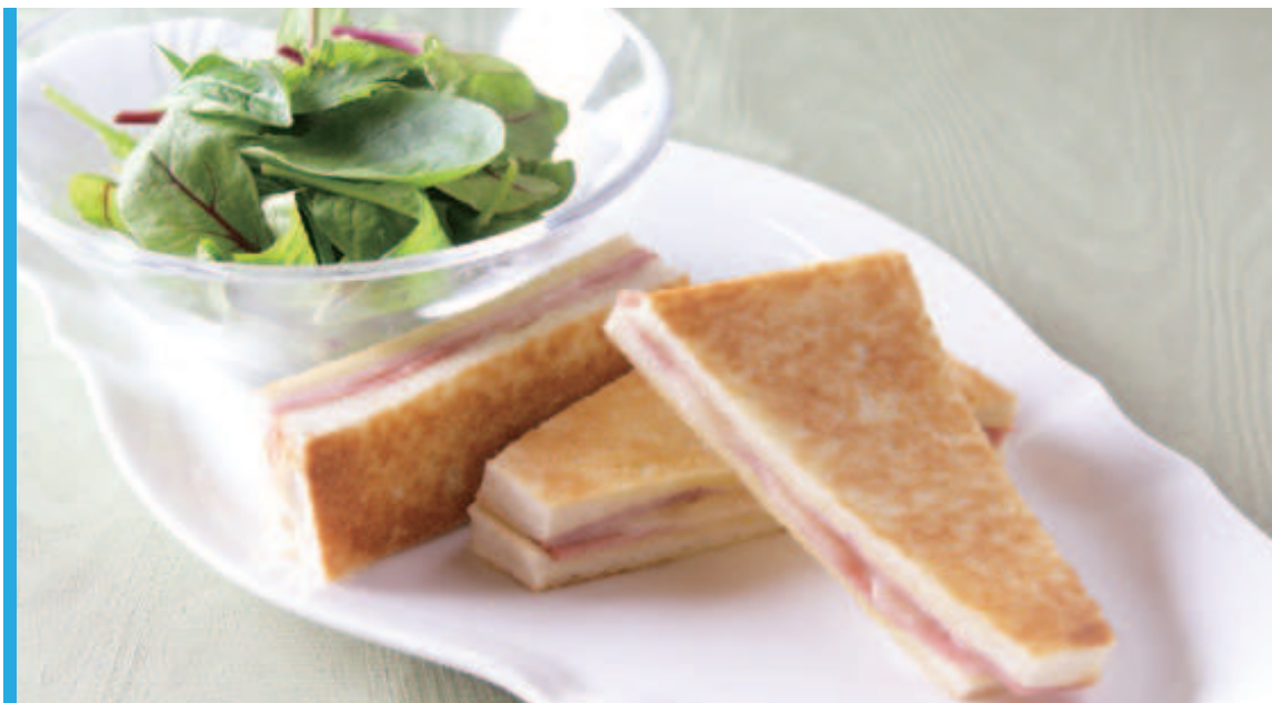
ホットサンドセット【ハム&チーズ】

Hot Sand Set <Ham&Cheese sand/Salad/Coffee or Tea>